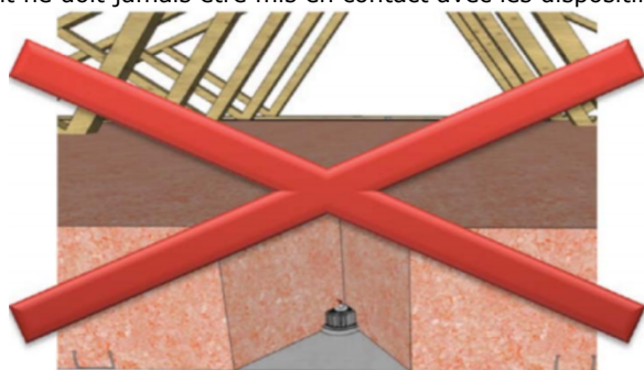
Figure 1 – Spot non protégé au contact de l'isolant INTERDIT

L'isolant ne doit jamais être mis en contact avec les dispositifs d'éclairage encastrés (Figure 1) :