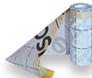
Vario® Xtra Band