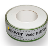
Adhésif Vario® Multitape