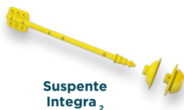
Suspente Integra 2