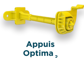
Appuis Optima 2