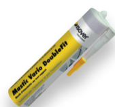
Mastic Vario® DoubleFit