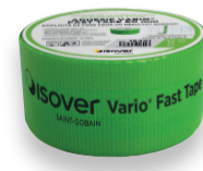
Adhésif Vario® Fast Tape