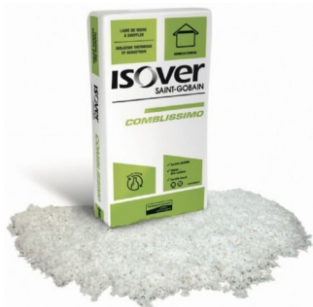
Laine de verre de couleur blanche en flocons