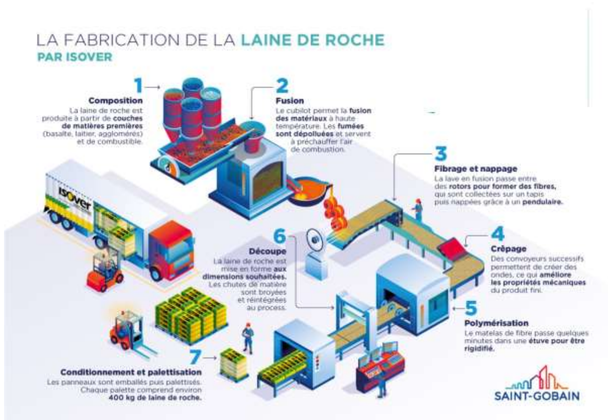
Diagramme du procédé de fabrication

La fabrication de laine de roche inclut les étapes de fusion et de fibrage (cf. diagramme du procédé de fabrication). De plus, la production des emballages est prise en compte à cette étape, incluant le prélèvement de CO 2 atmosphérique sous forme de carbone biogénique dans le bois de la palette.