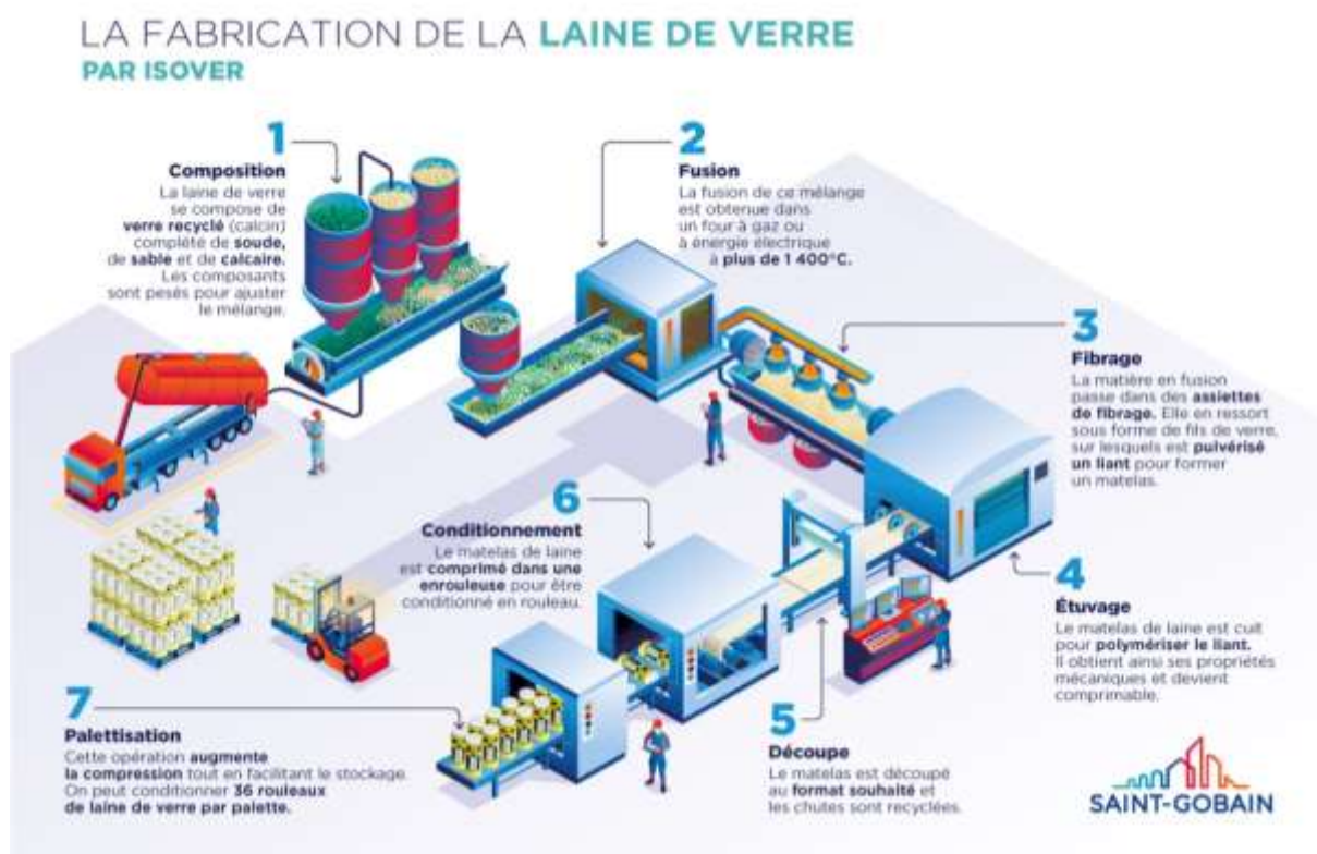
Diagramme du procédé de fabrication

La fabrication de laine de verre inclut les étapes de fusion et de fibrage (cf. diagramme du procédé de fabrication). De plus, la production des emballages est prise en compte à cette étape, incluant le prélèvement de CO 2 atmosphérique sous forme de carbone biogénique dans le bois de la palette.