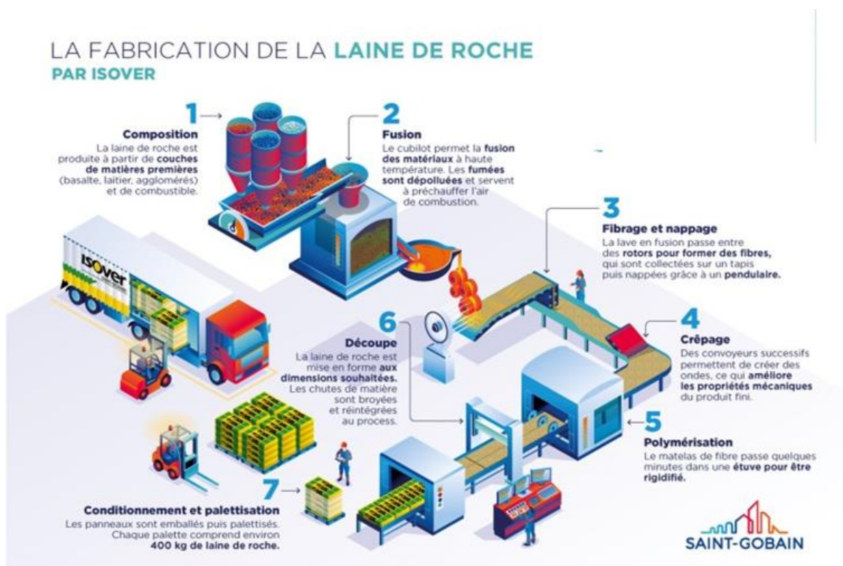
Diagramme du procédé de fabrication

La fabrication de laine de roche inclut les étapes de fusion et de fibrage (cf. diagramme du procédé de fabrication). De plus, la production des emballages est prise en compte à cette étape, incluant le prélèvement de CO 2 atmosphérique sous forme de carbone biogénique dans le bois de la palette.